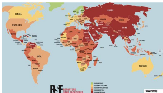
رتبه بندی کشورها از لحاظ آزادی مطبوعات در سال ۲۰۲۴

آلمان در این رده بندی در مقایسه با رتبه ۲۱ در سال ۲۰۲۳، امسال در رتبه دهم قرار گرفته و دلیل این امر، از جمله، کاهش تعداد حملات فیزیکی به کارکنان رسانه در سال گذشته بوده است.