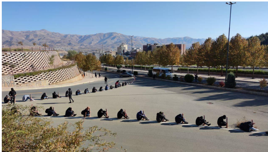
دانشجویان دانشگاه کردستان-سه‌شنبه ۲۴ آبان ۱۴۰۱

مذاکرات رفراندوم / رمز فریب مردم ما حرف حقو گفتیم / صدای تیر شنفتیم رئیس حراست / نماد وقاحت یه مملکت رو آبه / وعده‌هاشون سرابه فکر نکنید امروزه / قرار ما هرروزه قسم به خون یاران / ایستاده‌ایم تا پایان توپ تانک فشفسه / آخوند باید گم بشه بسیجی سپاهی / داعش ما شمایی هیز تویی هرزه تویی / زن آزاده منم بیزارم از دین شما / نفرین به آیین شما