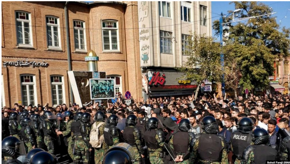
مواجهه پلیس ضدشورش و معترضان در مقابل موزه مردم‌شناسی ارومیه در ۲۵ آبان ۱۳۹۸

«با یکی از اقوام که در بازار مغازه دارد صحبت کردم. می‌گفت ما بازاری‌ها هیچ‌وقت هیزم بقیه نمی‌شویم و برای ما مهم کسب‌وکار خودمان است. امروز هم بی‌توجه به فراخوان ضدانقلاب مشغول کار روزمره بودیم که اوباش با شلوغ کردن در ورودی پاساژ باعث شدند مغازه‌داران از ترس غارت مغازه و اجناس‌شان تعطیل کنند. با اینکه طرفدار جمهوری اسلامی نیست، اما حساسی از ضدانقلاب شاکی بود که مانع کسب‌وکارشان هستند. حرفش این بود که چرا محکم‌تر با این‌ها برخورد نمی‌شود؟ خلاصه این‌که این مدل کارها اسمش انقلاب نیست. انقلاب یعنی همراهی توده‌های مردم برای انجام یک کار. نه اینکه با وحشی‌بازی و ایجاد ترس و اجبار، بقیه را مجبور به تعطیلی مغازه کنید تا از نان خوردن بیفتند. اگر اسم این کار انقلاب بود، امروز باید همه مغازه‌های تهران تعطیل می‌شد، اما غیر از بازار و چند جای دیگر که از ترس غارتگری اوباش تعطیل شده‌اند، مردم دارند کار خودشان را انجام می‌دهند.» مرور گزارش‌های رسانه‌های حکومتی چون «تسنیم»، «فارس»، «جام‌جم» و ... نیز، نشان می‌دهد که خط خبری آن‌ها از اعتصاب بازاریان در سالروز وقایع آبان ۱۳۹۸، آن‌گونه که نهادهای امنیتی و نظامی دیکته کرده‌اند نه حقیقت را.