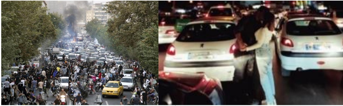
دختر و پسر جوانی در حال بوسیدن یکدیگر در اعتراضات شامگاه سه‌شنبه در شیراز

گزارش‌های منتشر شده در شبکه‌های اجتماعی در روز دوم فراخوان ۳ روزه اعتصاب‌ها، حکایت از بسته بودن برخی از کسب و کارها در شهرهای مختلف ایران دارد.