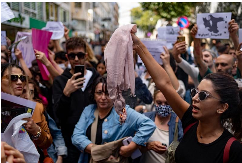
تجمع اعتراضی در استانبول ترکیه

هم‌زمان گروهی از شهروندان ترکیه و زنان و مردان ایرانی ساکن این کشور روبه‌روی کنسولگری ایران در استانبول اقدام به برگزاری تجمع کردند.